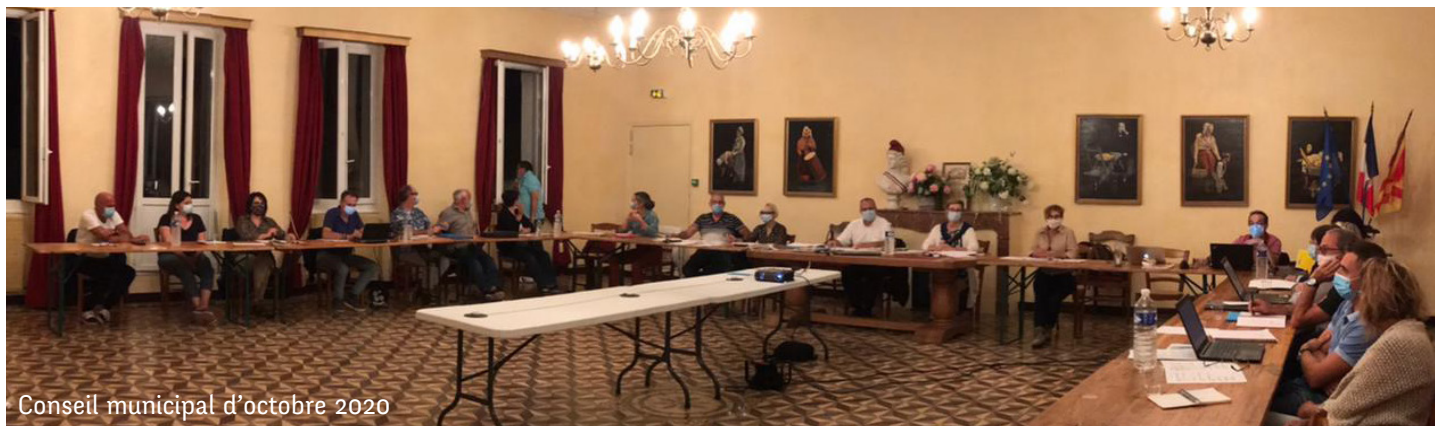
Conseil municipal d'octobre 2020